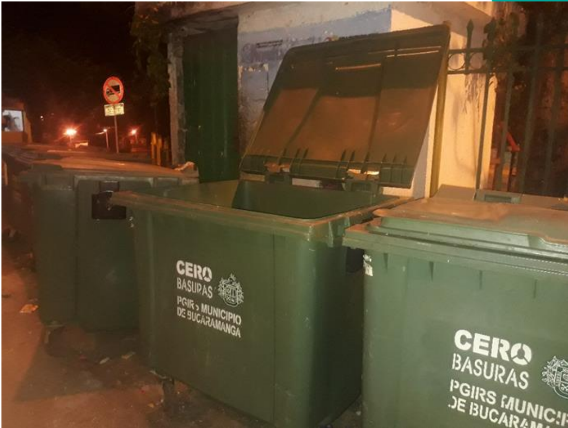
COMUNIDAD BARRIO KENNEDY. COMUNA UNO.