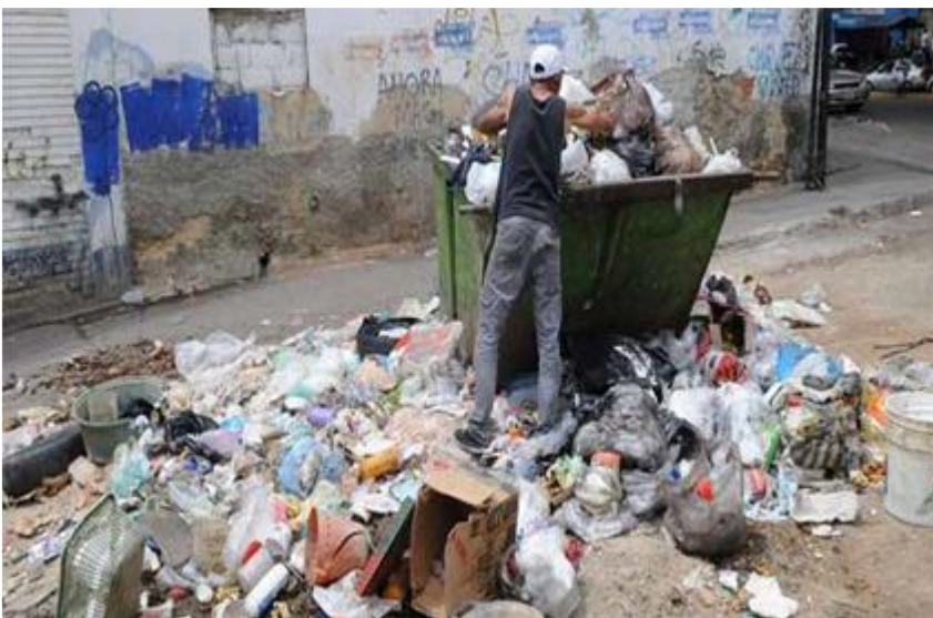
COMUNIDAD DEL BARRIO KENNEDY . COMUNA UNO.