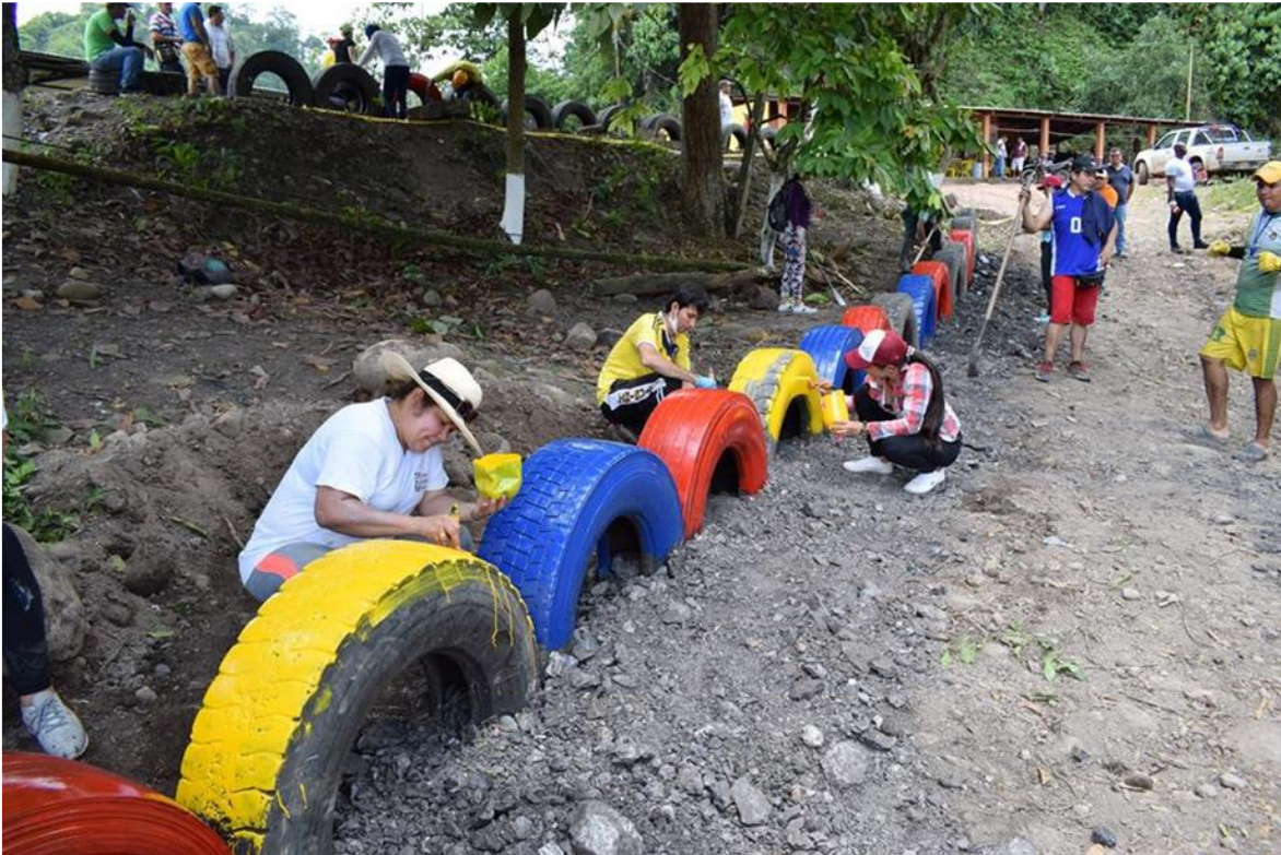
Comunidad del Cero