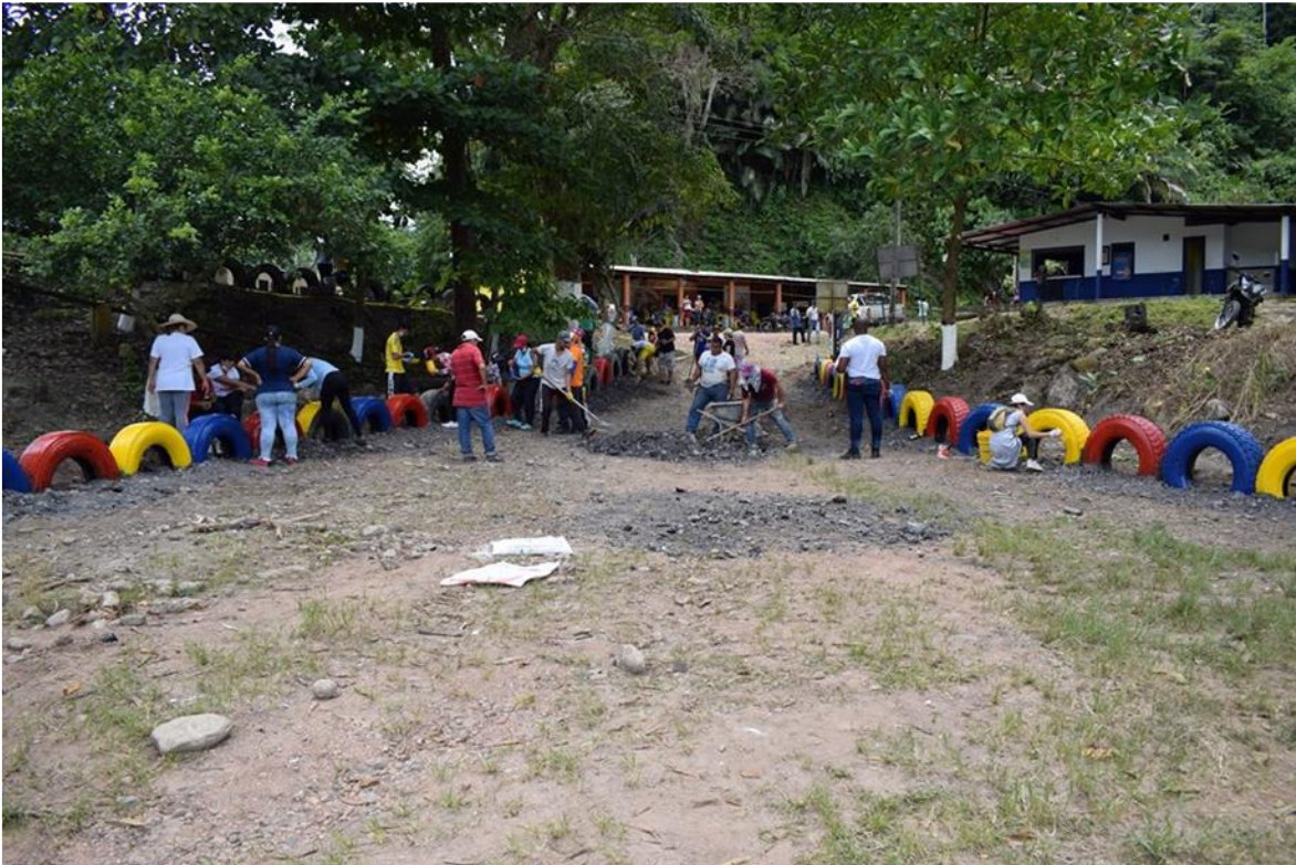
Culminando labor de embellecimiento